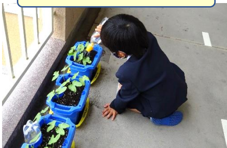
アサガオへの水やり

1年生の教室前の廊下には、アサガオを植えた鉢が並べられています。子どもたちは、きれいな花が咲くのを楽しみにしながら、毎日水やり励んでいます。