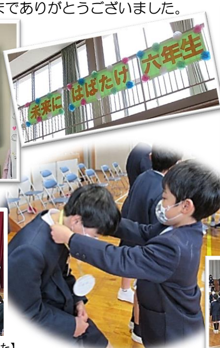
【6年生にお礼のメダルを渡しました】