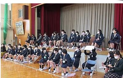
【6年生は体育館で各学年の出し物を見ました】