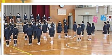
【6年生にお礼の言葉や出し物】