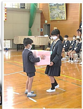
【6年生にプレゼント】